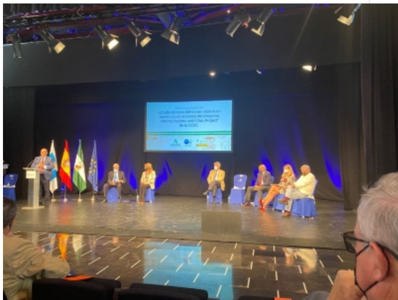
( http://www.ayto-tharsis.es/es/.galleries/imagenes-noticias/noticias-2017/WhatsApp-Image-2021-06-11-at-13.27.32.jpeg )