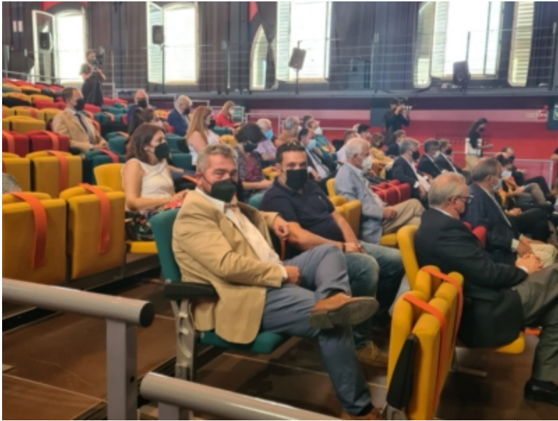
( http://www.ayto-tharsis.es/es/.galleries/imagenes-noticias/noticias-2017/WhatsApp-Image-2021-06-11-at-13.27.41.jpeg )