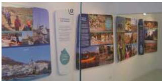
Sala de la Naturaleza