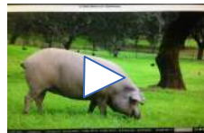
Video Promocional Cerdo Ibérico