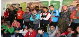
Sala Turismo Activo