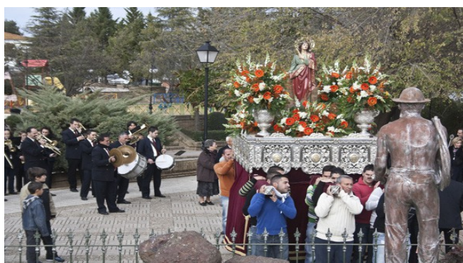
Aerogeneradores y vistas de las rampas en las cortas. Procesión de Santa Bárbara frente al monumento al minero. Tharsis.