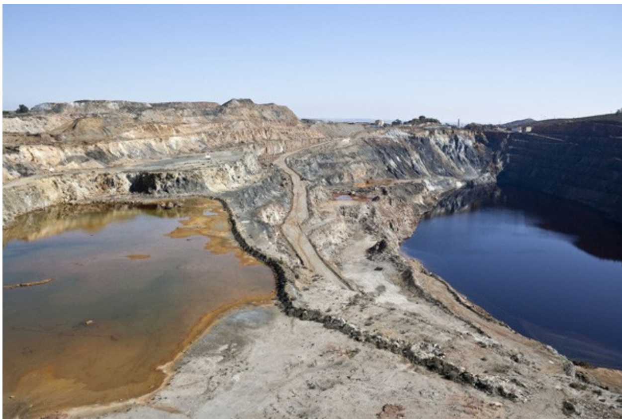
Cortas en las Minas de Tharsis.

Área/s: S3. Serranías de baja montaña. Ámbito/s: 2 Andévalo Occidental.